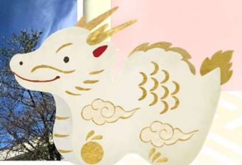
ベルジ箕輪の頭上に龍神雲が